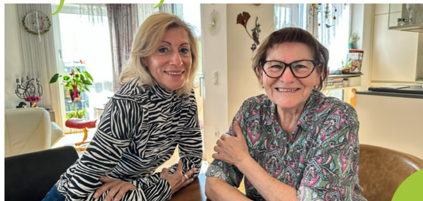
Wohnanlage Pregarten, Leherfeld