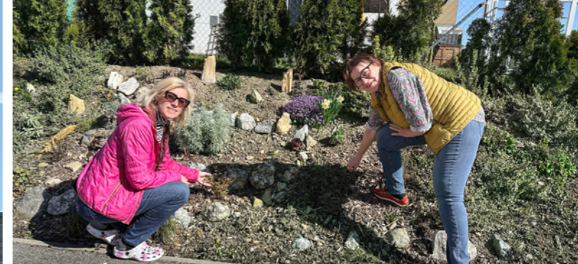
Gemeinsam angepackt: Die beiden Bewohnerinnen bei der Gestaltung der Hecke.

Durch Ihr Engagement hat sich Ihre Wohnanlage zu einem echten Vorzeigebispiel für gelebte Nachbarschaft entwickelt. In unserem Leitartikel geht es um „Gemeinschaft – wie gute Nachbarschaft gelingen kann“. Welche Bedeutung hat gute Nachbarschaft für Sie persönlich?